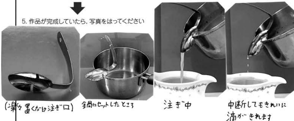
(楽々置くだけ注ぎ口)